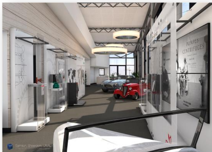
Show-room Wilo et Salmson

Les premiers moteurs Salmson sont nés en 1890 ; ils ont marqué l'histoire de l'industrie aéronautique et automobile française avant que l'entreprise ne concentre son activité autour des solutions de pompage. En 1961, Salmson installe son site de production à Laval en Mayenne. Un site qui deviendra commun aux deux marques en 1984 lorsque Salmson rejoint le groupe Wilo, l'un des leaders mondiaux du marché des pompes et systèmes de pompage, pour le secteur du bâtiment, de l'industrie et du cycle de l'eau.